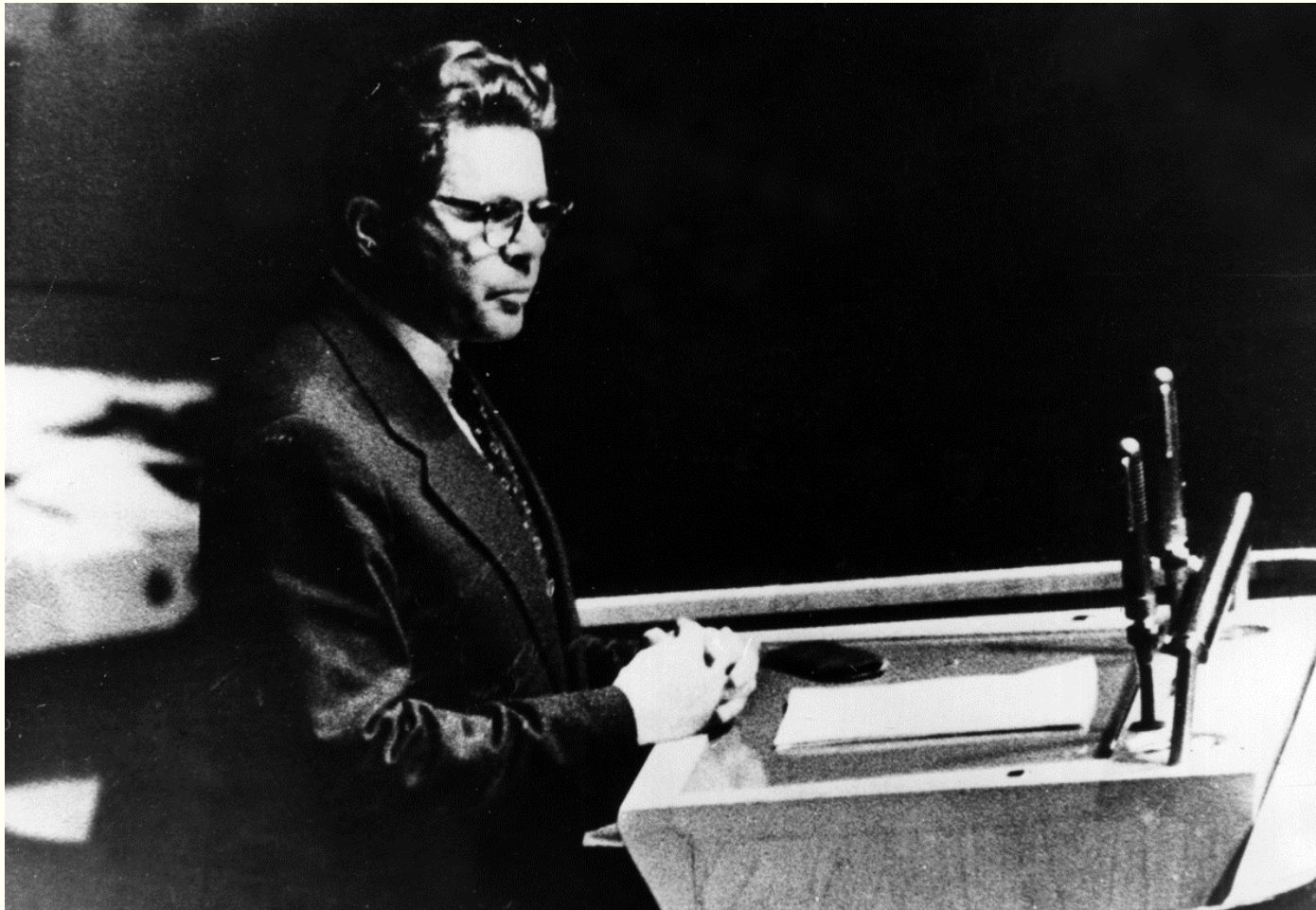
Міністр закордонних справ України Лука Паламарчук на трибуні XI сесії Генеральної Асамблеї ООН. м.Нью-Йорк, листопад 1956 року. Фоторепродукція. Із фондів Укрінформу.