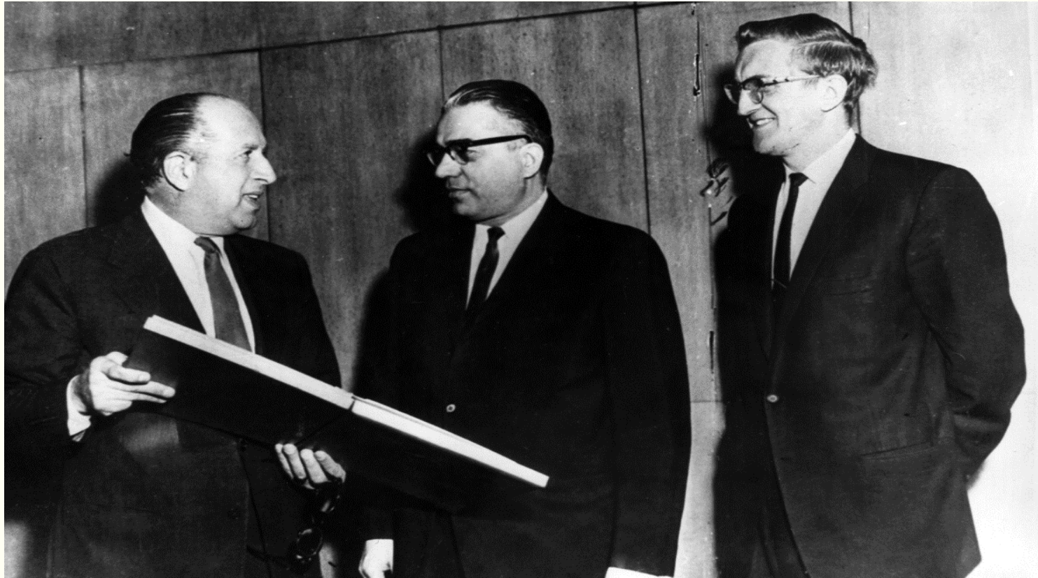
Постійний представник України при ООН Лука Кизя (праворуч) під час ратифікації Європейської Конвенції про зовнішньоторговельний арбітраж. м.Нью-Йорк, березень 1963 року. Фоторепродукція.