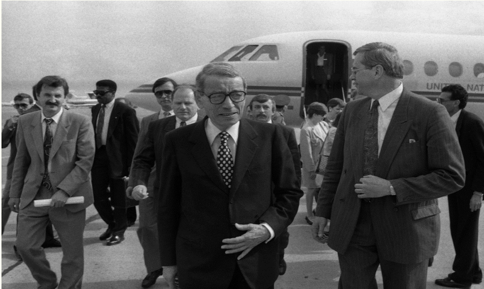
Зустріч Генерального секретаря ООН Бутроса Бутрос-Галі в Бориспільському аеропорту. Високоповажний гість відповідає на запитання журналістів. м.Київ, червень 1993 року.