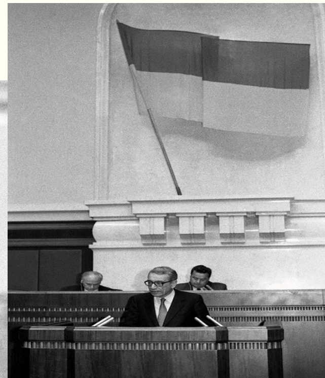
Виступ Генерального секретаря ООН Бутроса Бутрос-Галі в сесійній залі Верховної Ради України. м.Київ, червень 1993 року.