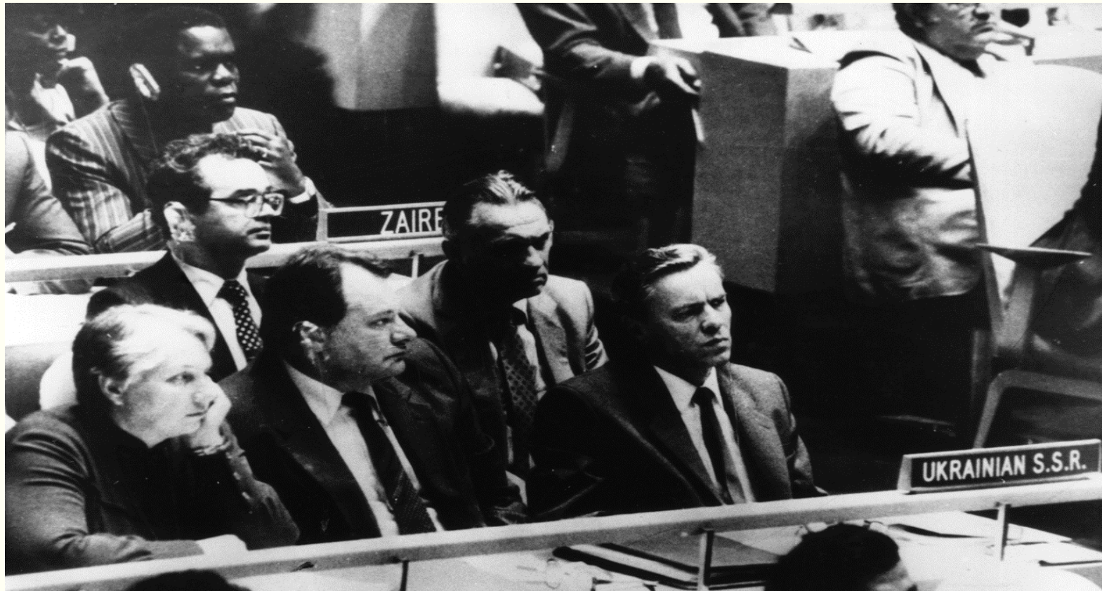
Делегація України на засіданні Генеральної Асамблеї ООН. Другий ліворуч - постійний представник України при ООН Геннадій Удовенко, перший праворуч - міністр закордонних справ України Володимир Кравець. м.Нью-Йорк, 24 вересня 1985 року. Фоторепродукція. Із фондів Укрінформу.