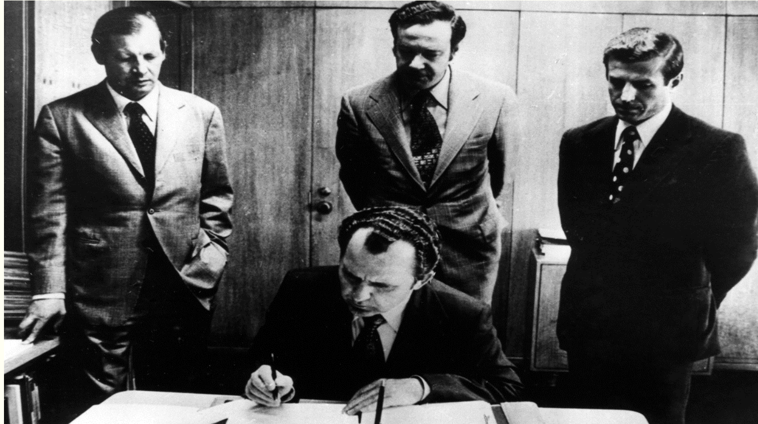
Постійний представник України при ООН Володимир Мартиненко підписує Конвенцію про захист дипломатів. м.Нью-Йорк, 18 червня 1974 року. Фоторепродукція. Із фондів Укрінформу.