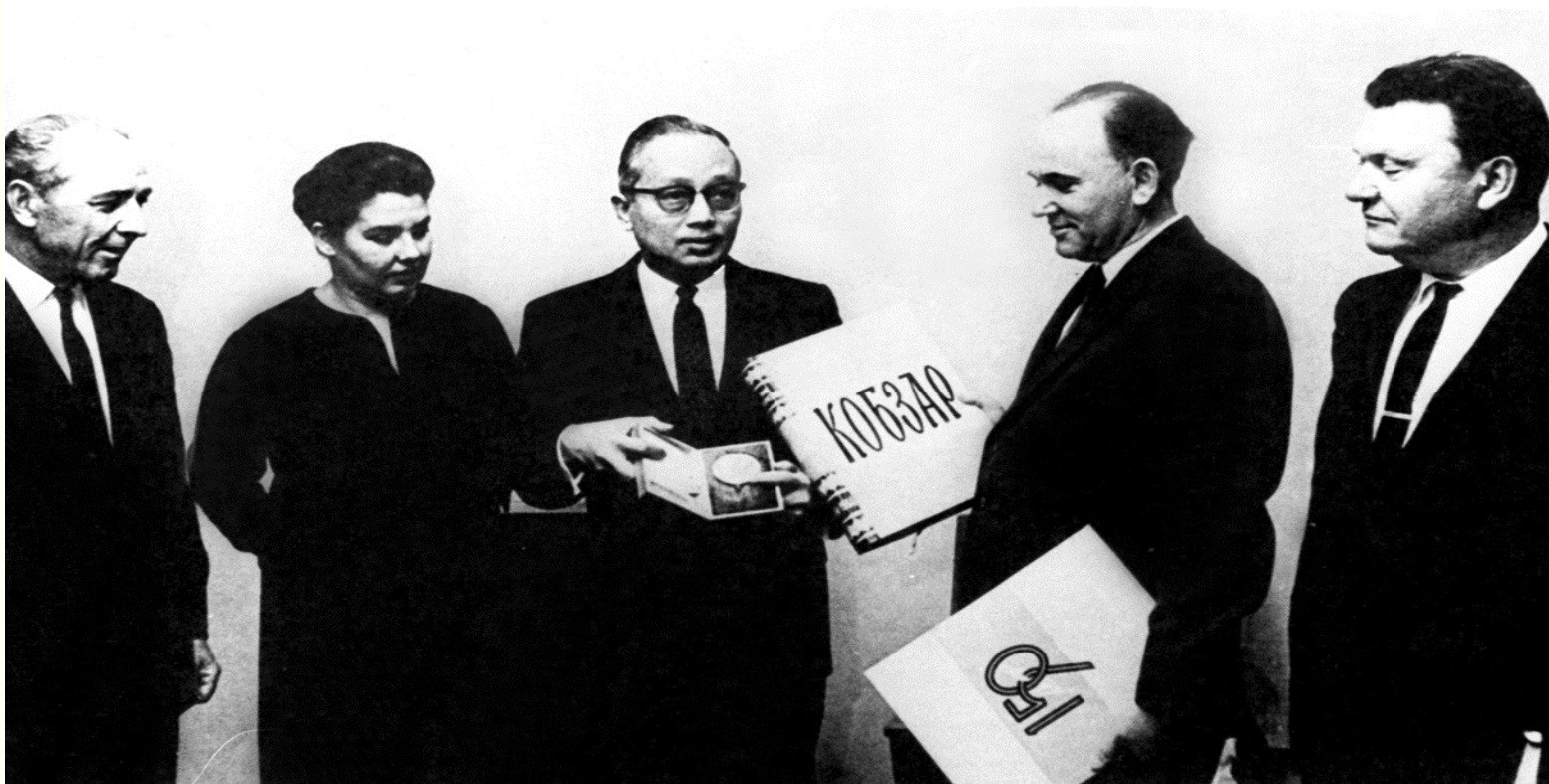
Із нагоди 150-річчя з дня народження Тараса Шевченка українська делегація вручила Генеральному секретарю ООН У Тану (в центрі) вибрані твори поета англійською мовою. м.Нью-Йорк, жовтень 1965 року. Фоторепродукція. Із фондів Укрінформу.