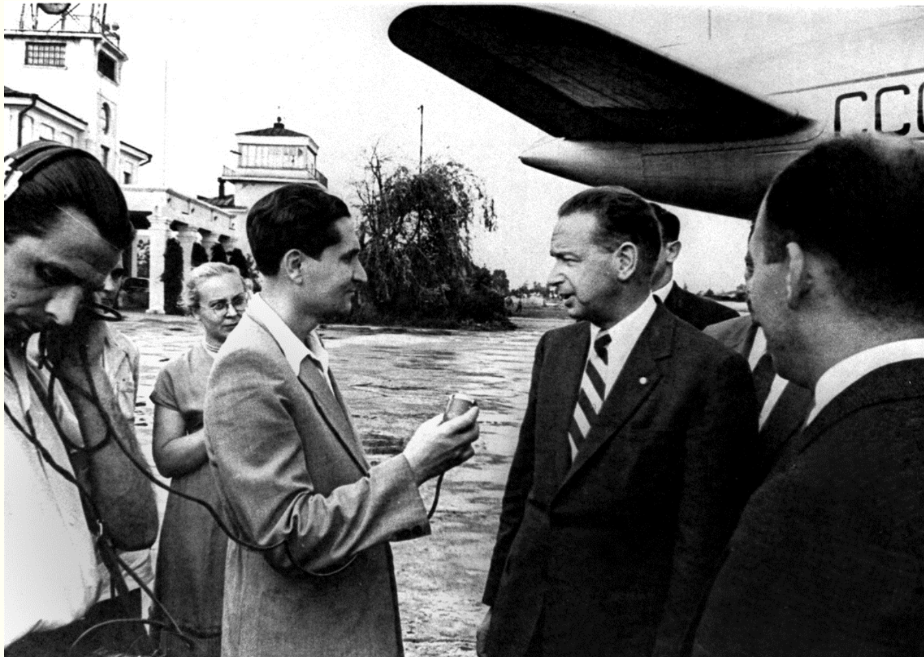
Генеральний секретар ООН Даг Хаммершельд на Київському аеродромі дає інтерв'ю. м.Київ, липень 1956 року. Фоторепродукція. Із фондів Укрінформу.