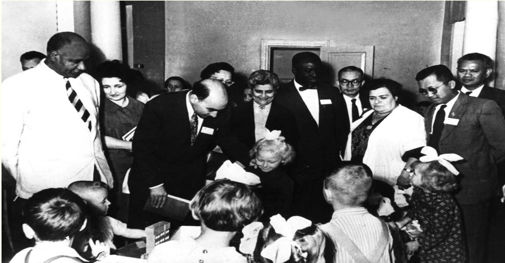
Учасники семінару Всесвітньої організації охорони здоров'я ООН серед вихованців дитячого садка заводу "Арсенал". м.Київ, вересень 1960 року. Фоторепродукція. Із фондів Укрінформу.