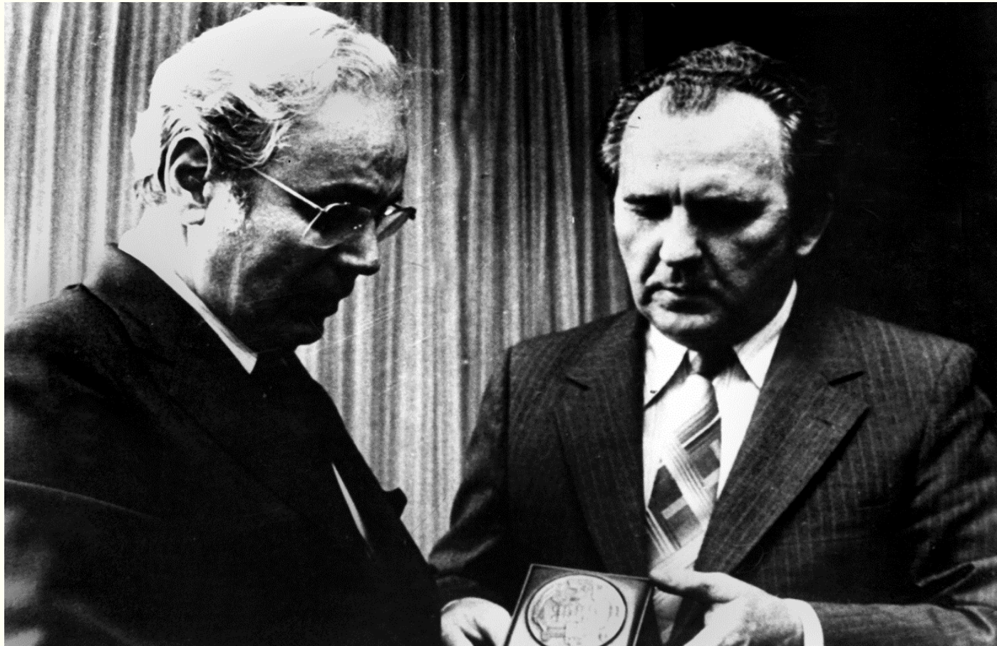
Міністр закордонних справ України Володимир Мартиненко (праворуч) вручає Генеральному секретарю ООН Пересу де Куельяру медаль "На честь 1500- річчя Києва". м.Нью-Йорк, червень 1982 року. Фоторепродукція. Із фондів Укрінформу.