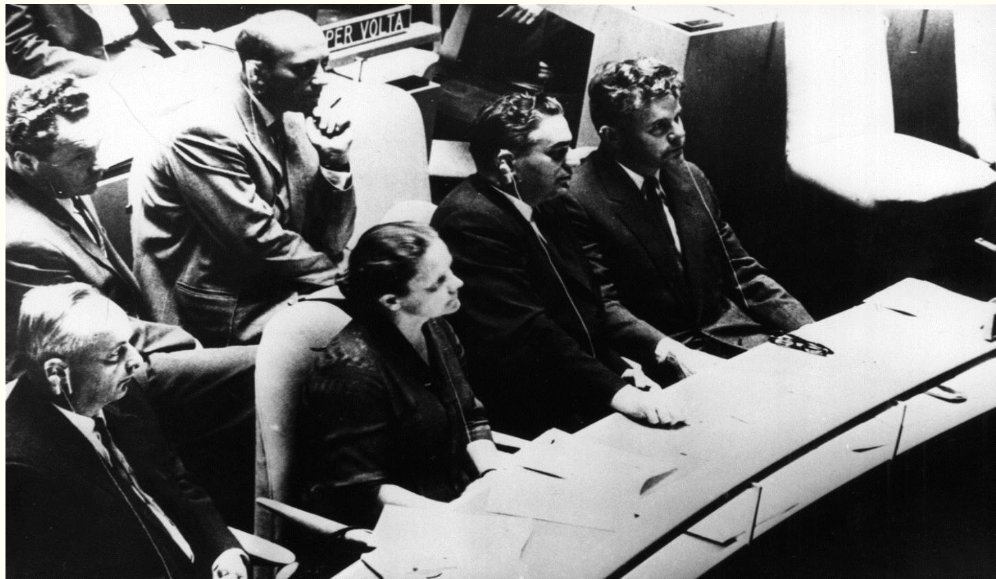
Делегація України на XVI сесії Генеральної Асамблеї ООН. м.Нью-Йорк, вересень 1961 року. Фоторепродукція. Із фондів Укрінформу.