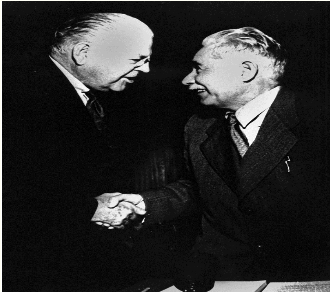
Представники Ради безпеки ООН Дмитро Мануїльський (праворуч) та Уоррен Остін (США) перед початком засідання Ради безпеки. м.Нью-Йорк. 11 липня 1949 року. Фоторепродукція. Із фондів Укрінформу.