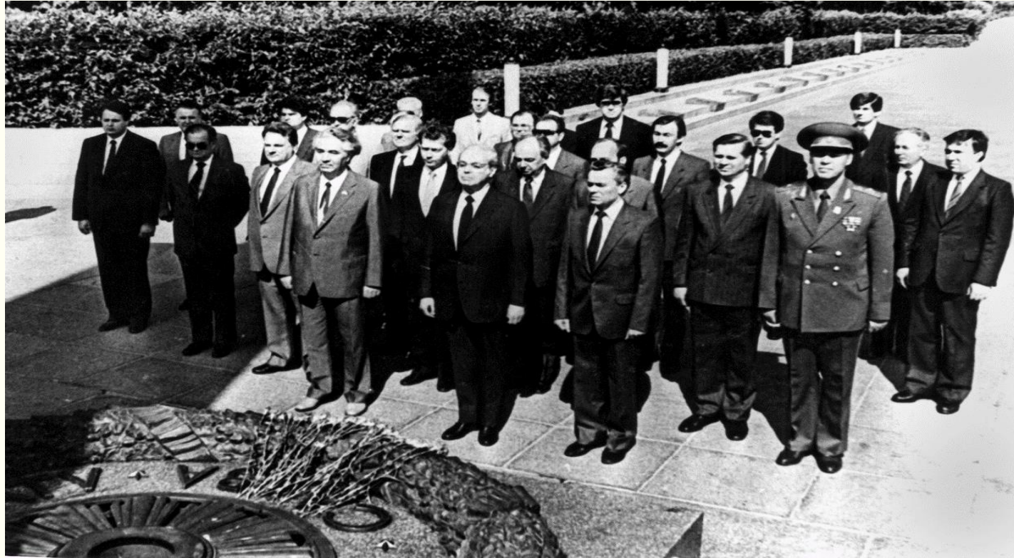
Генеральний секретар ООН Перес де Куельяр під час покладання квітів до могили Невідомого солдата в парку Вічної Слави в Києві. Червень 1987 року. Фоторепродукція. Із фондів Укрінформу.