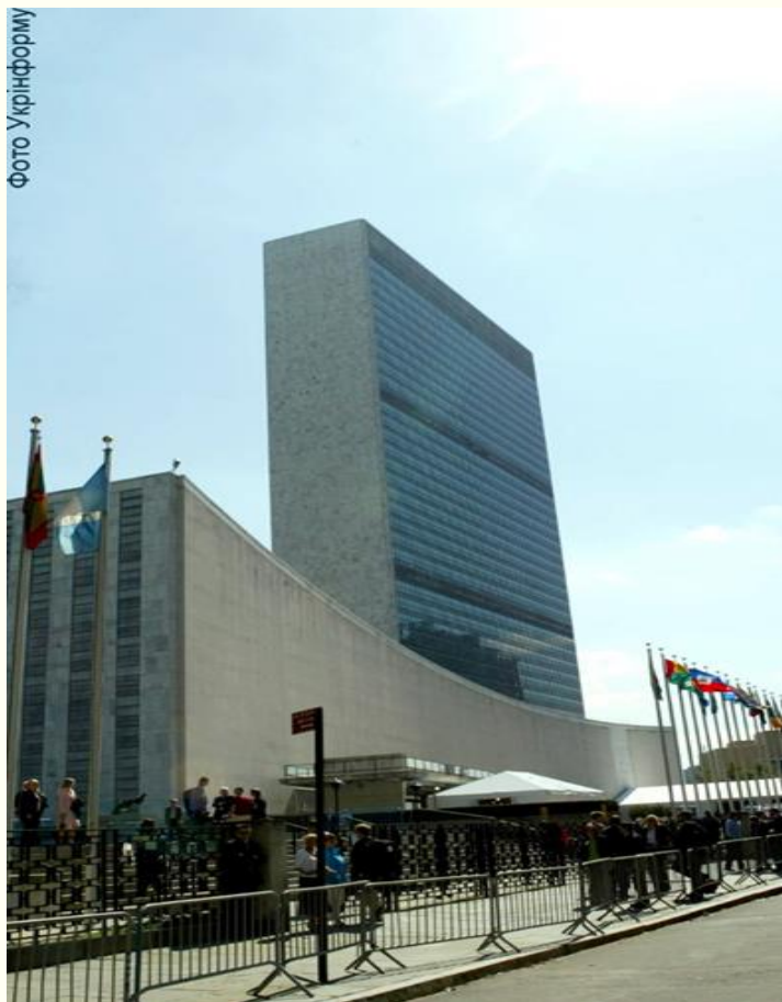
Штаб-квартира ООН - Зйомка 24 вересня 2003 року. м.Нью-Йорк.