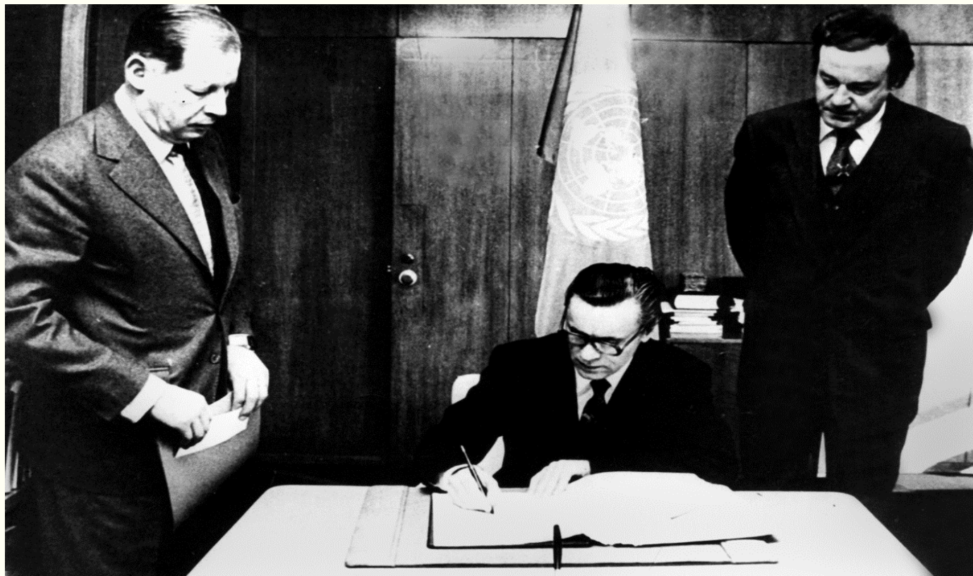
Постійний представник України при ООН Володимир Кравець підписує Статут ЮНІДО. Нью-Йорк. Грудень 1980 року. Фоторепродукція. Із фондів Укрінформу