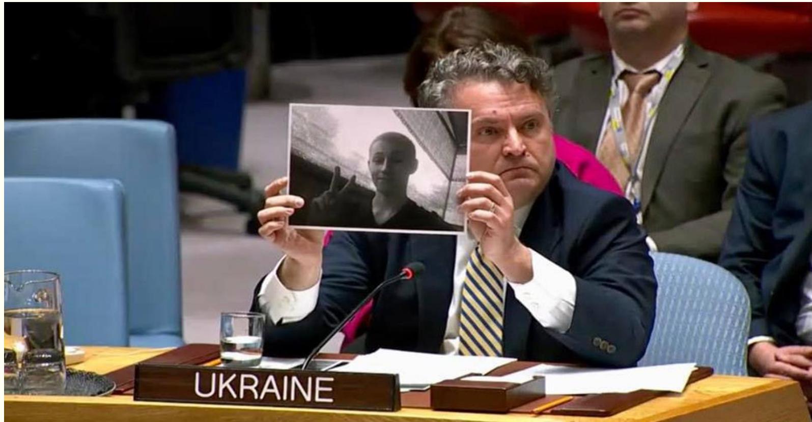
Заступник міністра закордонних справ Сергій Кислиця 18 лютого 2020 року під час засідання Ради Безпеки ООН. Фото зі сторінки у Твіттері Представництва України в ООН.