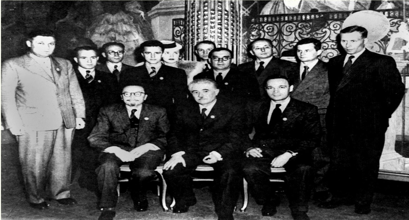
Делегація України (УРСР) на установчій конференції ООН у Сан-Франциско (1945 рік). Зліва направо (сидять): Володимир Палладін, Дмитро Мануїльський, Іван Сенін. Фоторепродукція. Із фондів Укрінформу.