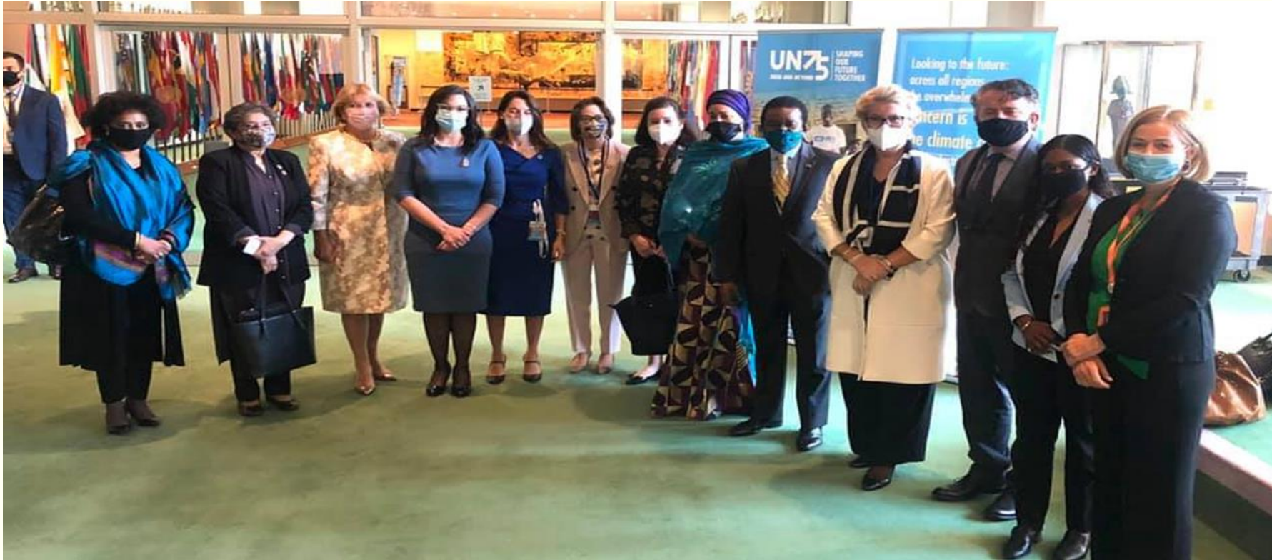
Фото постійних представниць своїх країн при ООН перед входом у залу Генеральної Асамблеї ООН. 24 вересня 2020 року, м.Нью-Йорк.