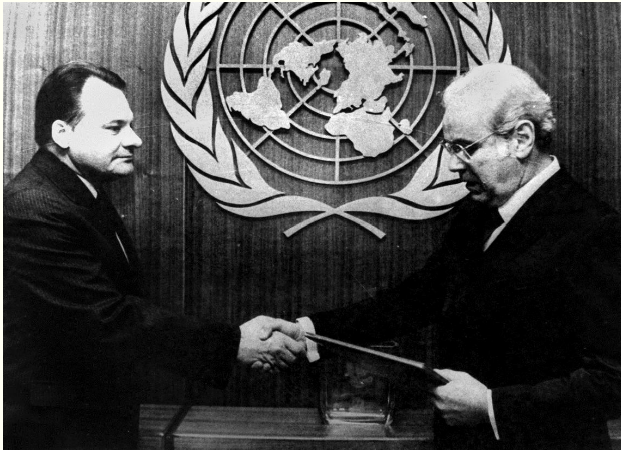
Постійний представник України при ООН Геннадій Удовенко (ліворуч) вручає вірчу грамоту Генеральному секретарю ООН Пересу де Куельяру. м.Нью-Йорк, 20 лютого 1985 року. Фоторепродукція. Із фондів Укрінформу.