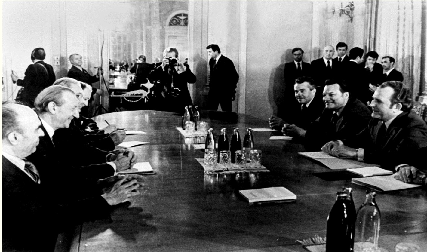
Генеральний секретар ООН Курт Вальдхайм під час зустрічі з міністром закордонних справ України Володимиром Мартиненком. м.Київ, травень 1981 року. Фоторепродукція.