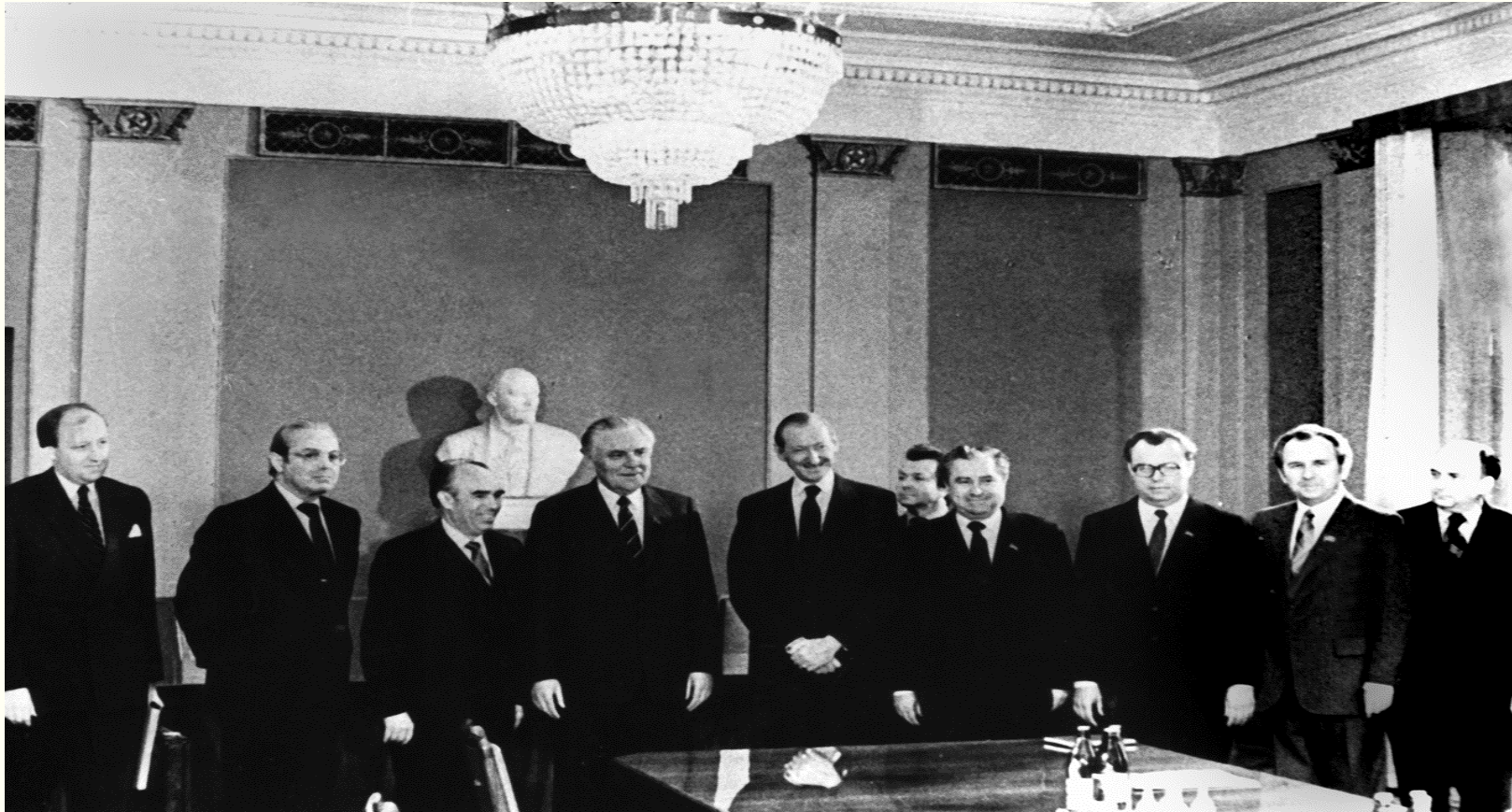
Генеральний секретар ООН Курт Вальдхайм під час зустрічі з першим секретарем ЦК КП України Володимиром Щербицьким. м.Київ, травень 1981 року. Фоторепродукція. Із фондів Укрінформу.