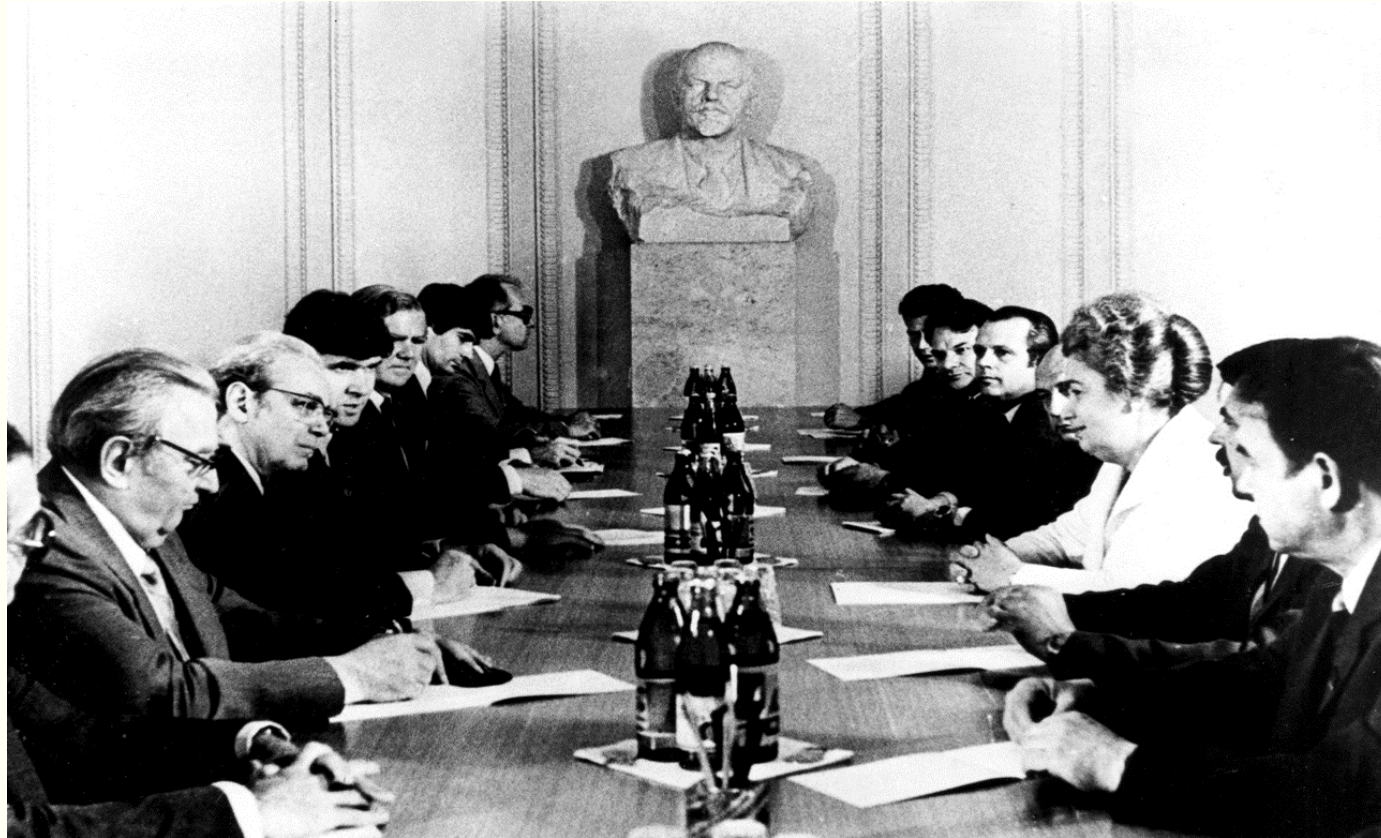
Генеральний секретар ООН Перес де Куельяр під час зустрічі з головою Верховної Ради України Валентиною Шевченко. Київ, червень 1987 року. Фоторепродукція. Із фондів Укрінформу.