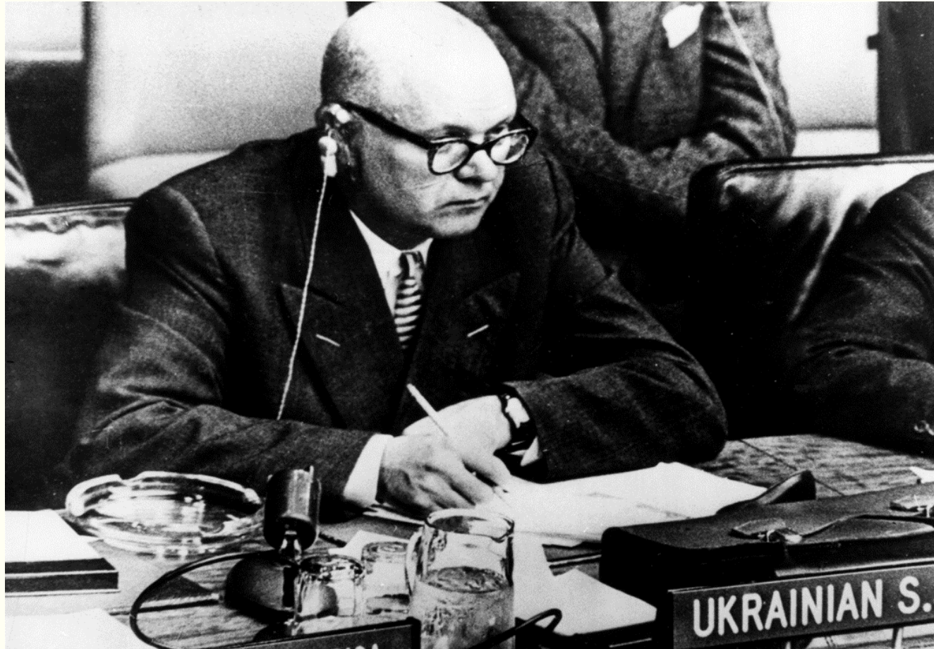
Представник України на XIV сесії Генеральної Асамблеї ООН Петро Недбайло на засіданні Генеральної Асамблеї. м.Нью- Йорк, жовтень 1959 року. Фоторепродукція.